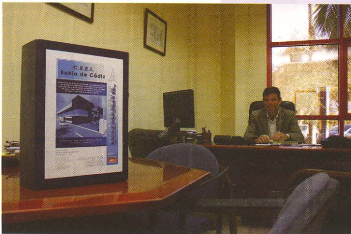
El nuevo proyecto del CEEI, su propio edificio, ya es una realidad

Dentro de cada una de estas áreas, CEEI Bahía de Cádiz dispone de un equipo especializado, que atiende la demanda específica de cada emprendedor o empresario de manera individualizada, se desplaza a las empresas para prestar los servicios demandados "en casa del empresario" con el fin de facilitar que éste pueda dedicar todo el tiempo posible a su actividad profesional y no tenga que perderlo en otras actividades distintas a su proceso productivo.