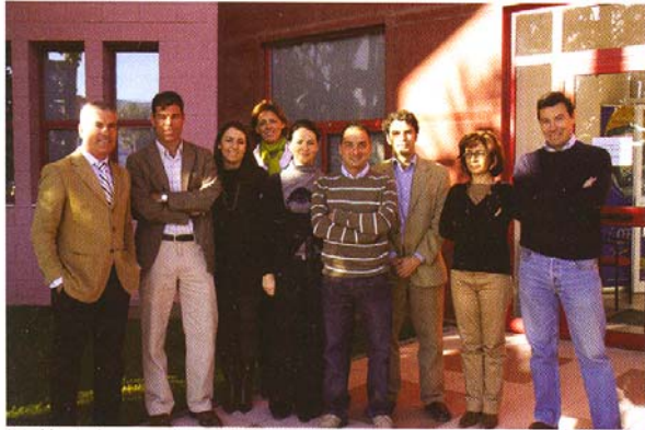
Parte del equipo humano que forma el CEEI Bahía de Cádiz, junto a nuestro Editor

También CEEI Bahía de Cádiz acude a convocatorias de proyectos nacionales o bien comunitarios con el fin de poder prestar ciertos servicios a los emprendedores y empresarios, sin que éstos tengan que pagar importe alguno en ciertos casos, o bien el mínimo importe posible en otros por los servicios que reciba.